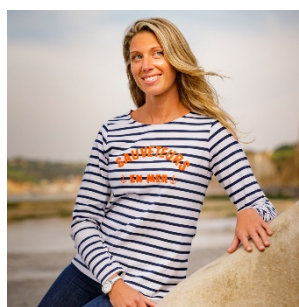
Marinière capocéan – marquage Sauveteurs en Mer – 25€