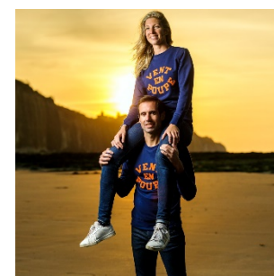
Sweat adulte « Vent en poupe » coupe mixte – 39,90€