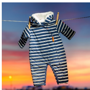
Combi-pilote bébé – doublée et dispose d'une capuche - 39€