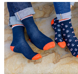
Pack de trois paires de chaussettes 25€