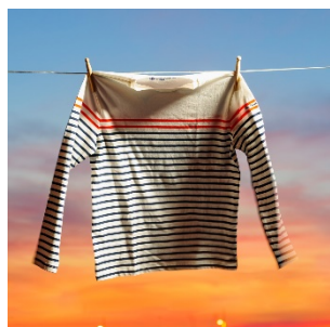
T-shirt rayé enfant 100% coton – 14€