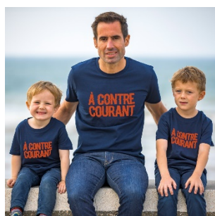
T-shirt « A contre courant » 100% coton bio – 24,90€ / 14€