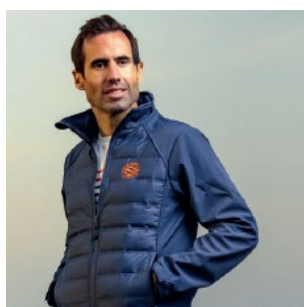
Blouson alpha hybride, mi-softshell, mi-doudoune – 75€

Retrouvez ci-dessous une belle sélection de cadeaux de Noël pour toute la famille :