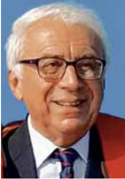
XAVIER DE LA GORCE Président des Sauveteurs en Mer (SNSM)

Document validé par les commissaires aux comptes le 2 novembre 2016. Toutes ces informations sont issues du rapport annuel d'activités 2015, disponible sur le site internet www.snsn.org